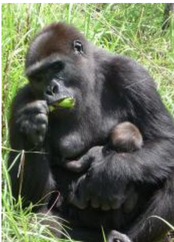
Djembo et son bébé de 3 jours

« Le trafiquant a ainsi été condamné à un emprisonnement d'une année ferme et au versement de 1.100.000 Fcfa »