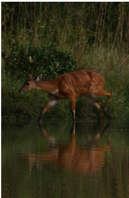
Sitatunga au site d'Iboubikrô