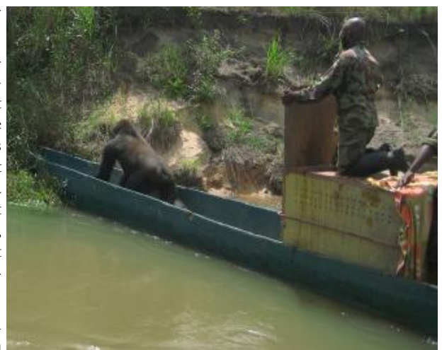
Kélé sortant de sa cage de transport lors de son transfert de la zone de la Loubilika vers Abio